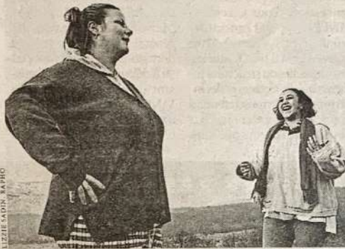
Artisans, commerçants, agriculteurs et ouvriers sont les plus gros.

ait un peu de relâchement. Questionnaires. Ce travail (1) — conçu par la Sofres — a consisté à adresser plus de 20 000 questionnaires à des foyers «représentatifs de la population des ménages ordinaires». Plus de 15 000 ont été retournés. Il s'agit, au final, d'une analyse des 30 921 individus qui étaient concernés par les réponses, parfois familiales. Les 8% d'adultes obèses ont des mensurations moyennes de 89 kg pour 1,67 m. Parmi eux, l'étude évalue que 100 000 à 200 000 personnes sont affectées d'une obésité morbide; dans ce dernier groupe, le poids moyen est de 117,3 kg pour une taille moyenne de 1,63 m. Facteurs. Il n'y a pas de différence nette entre hommes et femmes, «si ce n'est que les femmes sont plus touchées par les formes les plus graves d'obésité». En second lieu, l'obésité croît avec l'âge, jusqu'à 55-64 ans, pour diminuer ensuite. Autre clivage, l'influence de la profession: les artisans commerçants, les agriculteurs et les ouvriers sont de loin les plus gros. Enfin, dans le lot de ces facteurs discriminants, le taux d'obésité varie très significativement selon les régions (voir la carte).