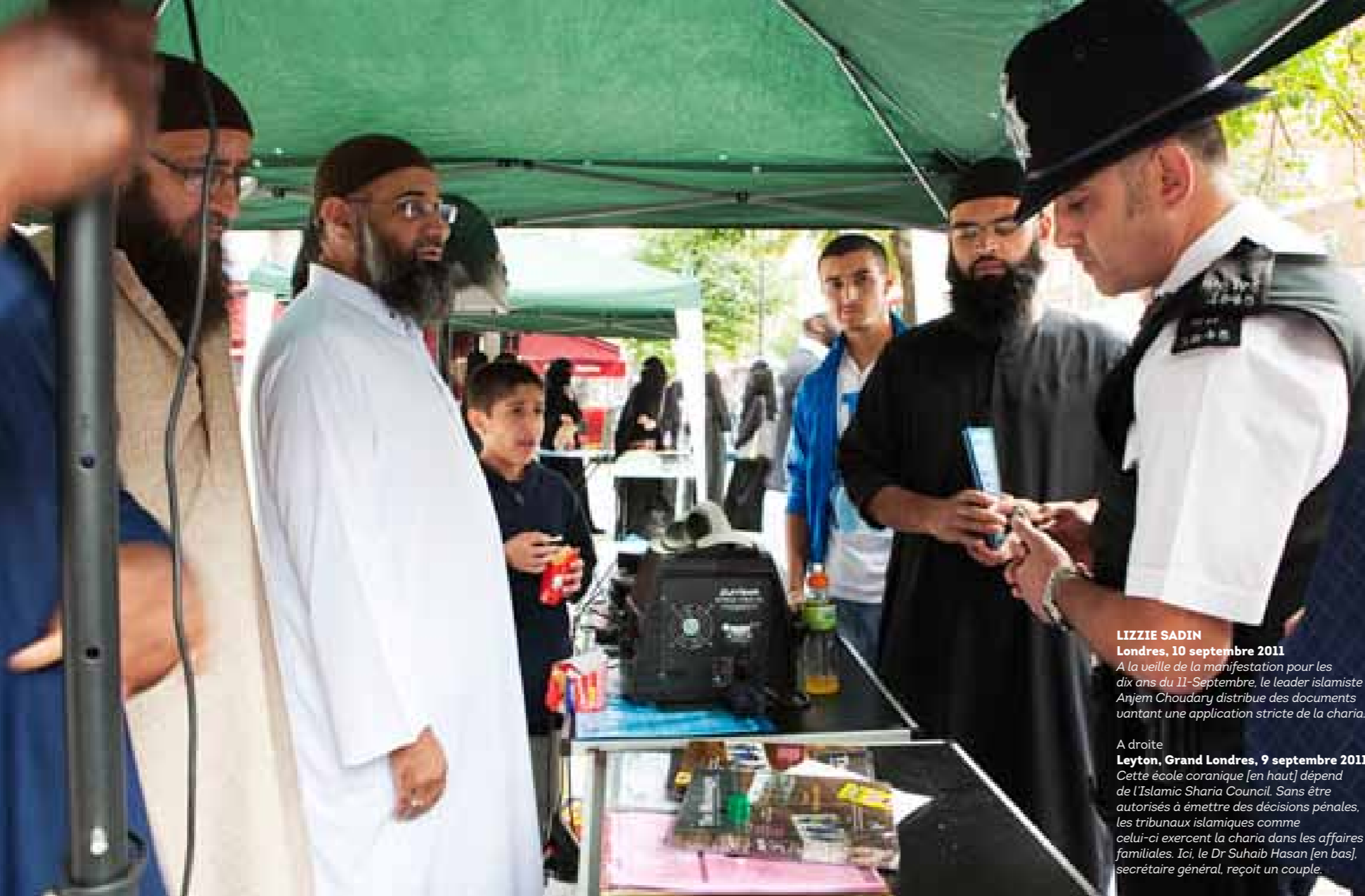
LIZZIE SADIN Londres, 10 septembre 2011 A la veille de la manifestation pour les dix ans du 11-Septembre, le leader islamiste Anjem Choudary distribue des documents vantant une application stricte de la charia.