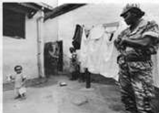
WYKAZANE / Wykazano, że służby więziennicze w Europie Zachodniej wykorzystują mężczyzn z Afryki Zachodniej do pracy w przemyśle i rolnictwie. Według Amnesty International, w tym celu służby więziennicze wykorzystują ich jako „nielegalną imigrację”.